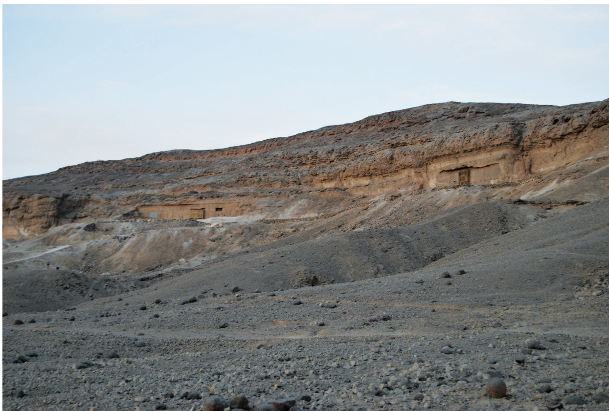
Fot. 2 Widok na Północne Grobowce Skalne

zachowane malowidła, z wizerunkami apostołów, jak m.in.: Andrzeja, Jana i Jakub, czy Piotra, Bartłomieja, oraz Chrystusa i Maryje 27 . Odkryte w Amarna ostrakony, pozwalają sądzić, że obszar ten znany był jako Teclooce , co dosłownie oznacza „drabina” 28 , określenie często łączony z monastycyzmem w Egipcie 29 . Jak stwierdza B. Kemp, niewielka społeczność Kom el-Nana musiał znajdować się na zewnętrznych krańcach administracyjnej hierarchii tego czasu, które posiadały swoje centra w prowincjonalnych miastach jak Hermopolis Magna czy Antinopolis 30 .