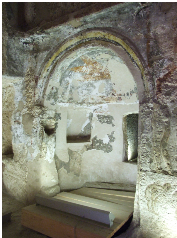
Fot. 3A/3B. Apsyda w grobowcu Panehesy

w klifie, należący w okresie panowania króla Achenatona, do jego dygnitarza Panehesyego, posiadającego między innymi tytuły: „Głównego Sługi Atona w Achetaton” czy „Drugi Prorok Pana Obydwu Krajów” 34 . Przestrzeń wykutego w skale okazałego grobowca, został wtórnie wykorzystany przez wspólnotę chrześcijańską i dodatkowo przekształconą 35 , między innymi usuwając kolumny, tworząc równocześnie w północnej ścianie grobowca, formę nawy z absydą, w której ulokowano między innymi chrzcielnicę 36 . To przeformułowanie części wnętrza grobowca, nastąpiło w okresie od połowy V do połowy VII wieku po Chr. 37 Jak wykazała, prowadząca tutaj badania, Gillian Pyke, w aspekcie odkrytych w grobowcu chrześcijańskich malowideł, The theme of Resurrection and special attention to the depiction of this individual could be used to argue for a funerary aspect to the church.