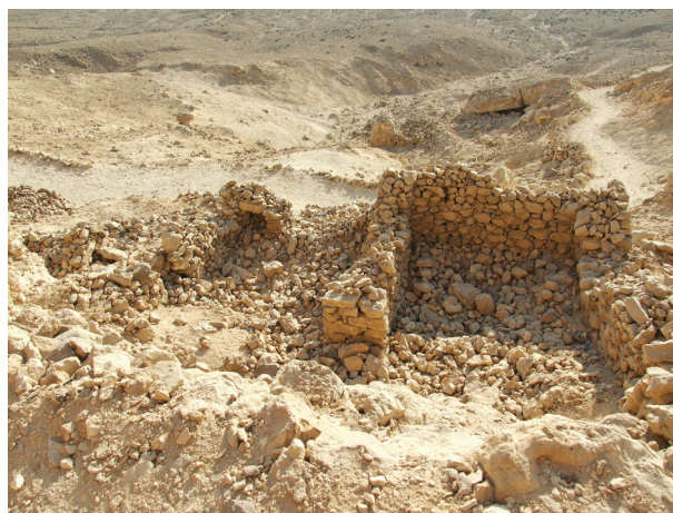
Fot. 4A/4B. Pozostałości domostw wspólnoty chrześcijańskiej w rejonie Północnych Grobowców Skalnych

Jak ustali badacze, wszystkie wydrążone w klifie północnym grobowce, pochodzące z okresu panowania Achenatona, oraz szereg znajdujących się tutaj naturalnych jaskiń zostało w przeszłości w większy, lub też mniejszy sposób przeorganizowane oraz zmodyfikowane, by stać się mieszkaniami czy sanktuariami, rozwijającej się tutaj wspólnoty. Wbrew wcześniejszym opinią stwierdzono, że tak przystosowanych i przeformowanych przestrzeni było w sumie siedemdziesiąt dwie 40 . W czasach, o których tutaj mowa, chrześcijanie koptyjscy, osiedlali się zarówno w samych grobowcach jak też i wokół nich, o czym dobitnie świadczą relikty konstrukcji kamiennych domów. Ich pozostałości, w postaci jeszcze czytelnych kamiennych ścian, przylegających niekiedy do fasady grobowców lub też wzniesionych nieco poniżej drogi, na terasach, są stosunkowo łatwymi do rozpoznania 41 .