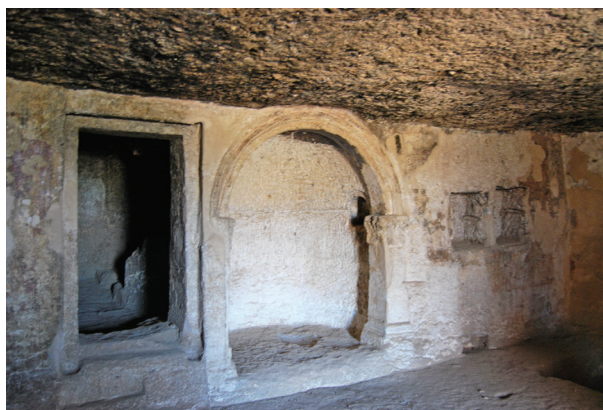
Fot. 5A/5B. Apsyda, znajdująca się w grobowcu Urirni (V Dynastia), na stanowisku Szejjch Said

i innych kategorii dostępnych zabytków, pozwala wysunąć sugestię wskazującą na egalitaryzm społeczności niegdyś tu żyjącej. Społeczności, której strukturę organizacyjną można określić jako grupę monastyczną. Jak twierdzi G. Pyke, there is no particular evidence for quarrying or other industrial activity. It is most likely a monastic foundation of some kind 44 . Co pozostaje także ważne, szczególnie w kontekście określanie ram chronologicznych użytkowania tego miejsca, badacze wskazali na braki widocznych zmian w konstrukcji samych domostw, z czego należy wysnuć wniosek, że ludność je użytkująca nie zajmowała tego obszaru wyjątkowo długo. Jak stwierdza Darlene L. Brooks Hedstrom, w swoim opracowaniu pt. Monastic landscape of late antique Egypt an archaeological reconstruction , cyt. With the presence of Kom el-Nana in the northern plain below the tombs, it seems that the church and settlements at the North Tombs were likely part of a monastic community 45 . Wyjątkowo ważne, odnoszące się bezpośrednio do sfery ekonomicznej społeczności zamieszkującej ten teren, to identyfikacja obecności krosien, co powala sądzić, że mieszkająca niegdyś tutaj grupa zajmowała się charakterystyczną dla Koptów gałęzią rzemiosła, czyli tkactwem 46 . Wyroby tkackie, szczególnie odzierze, zostawała zapewne zbywane w okolicznych miastach,